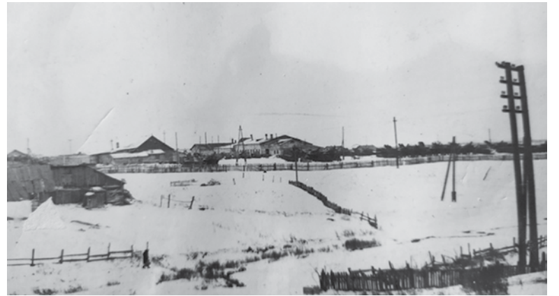
Помещения Болотнинской машинно-тракторной станции (МТС) в конце 1930-х годов.

В 1936 году на базе Болотнинского птицекомбината, занимавшегося откормом домашней птицы, возник будущий Болотнинский мясокомбинат — цех,