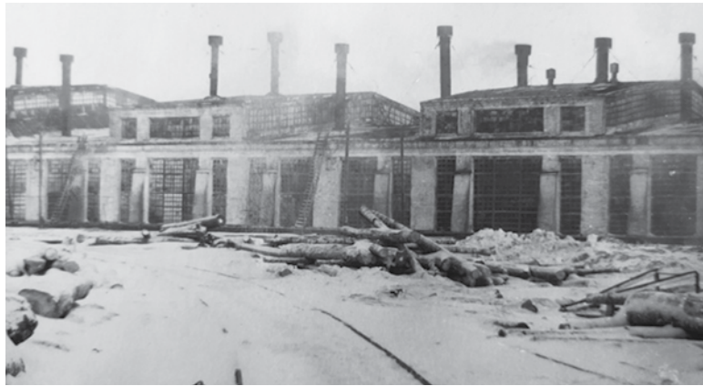
Болотнинское паровозное депо в конце 1930-х годов.

В 1931 году в Болотном была создана артель «Транспортник», позднее преобразованная в артель «Разнопром». На базе «Транспортника» в начале 1930-х годов в Болотном был создан кирпичный завод. Вероятно, одновременно с этим предприятием в поселке функционировал кирпичный завод